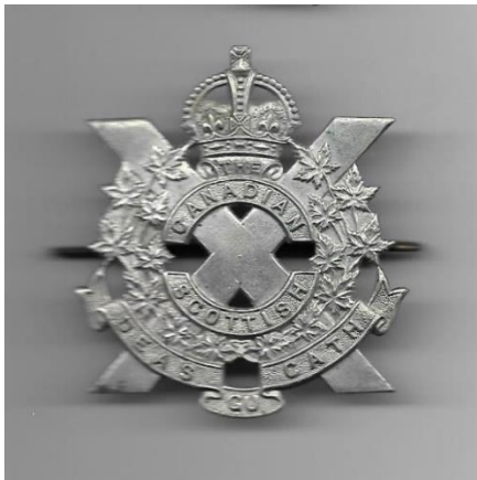
Cap Badge Pin van Richard Harold Flebbe.